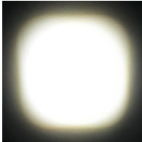
Ausleuchtfeld 450 mm x 450 mm Illumination field 450 mm x 450 mm alle Werte können um ± 15% variieren all values may vary ± 15%